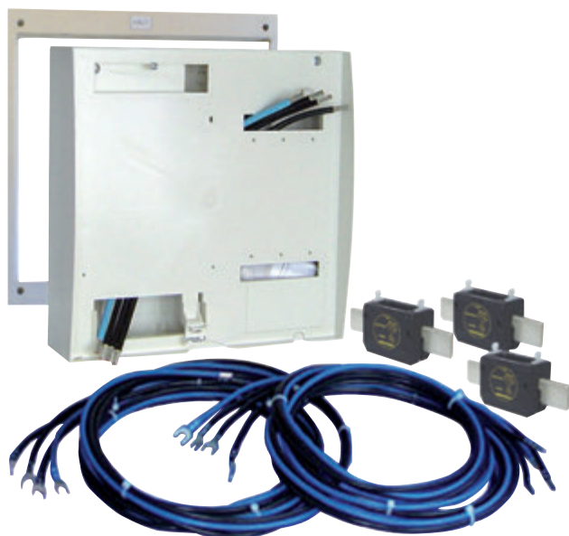
Kit passage BPS 200/400 - BPL 36 kVA (R013)